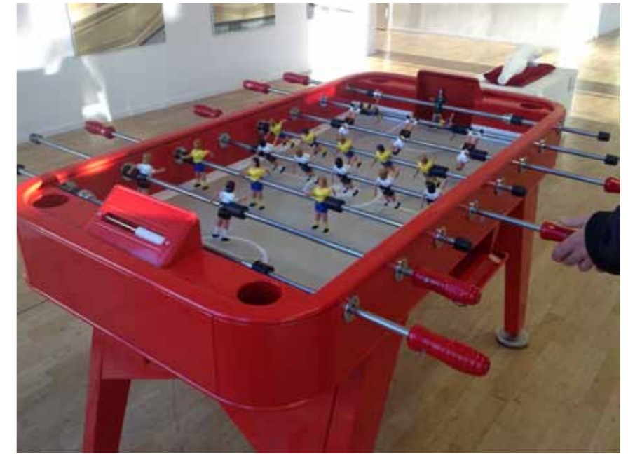
Fotbollsspelet RS#2 - en del av det lekfullt interaktiva på ATLETISKT. www.adessostockholm.se