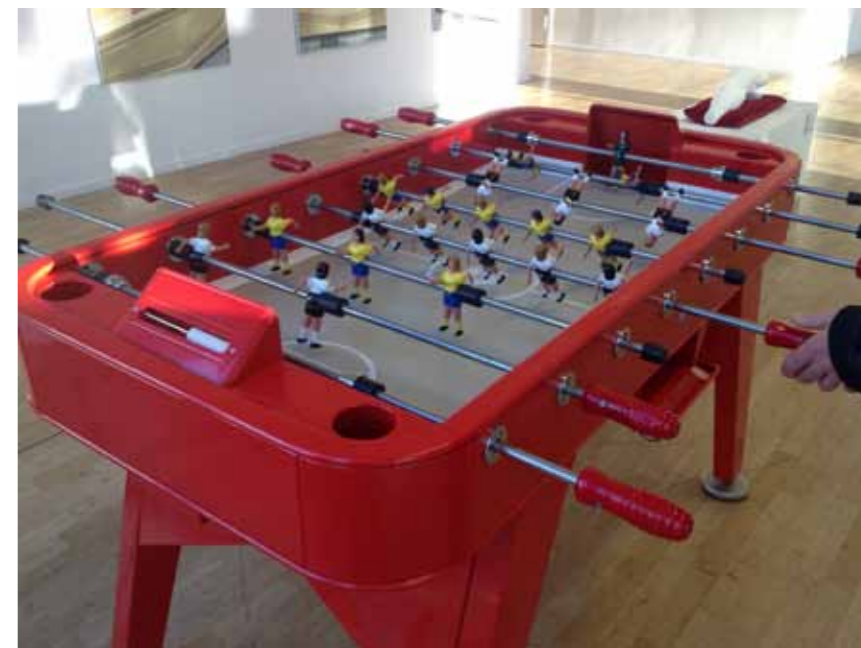
Fotbollsspelet RS#2 - en del av det lekfullt interaktiva på ATLETISKT. www.adessostockholm.se