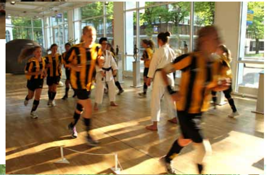
Markerad Omarkerad performance